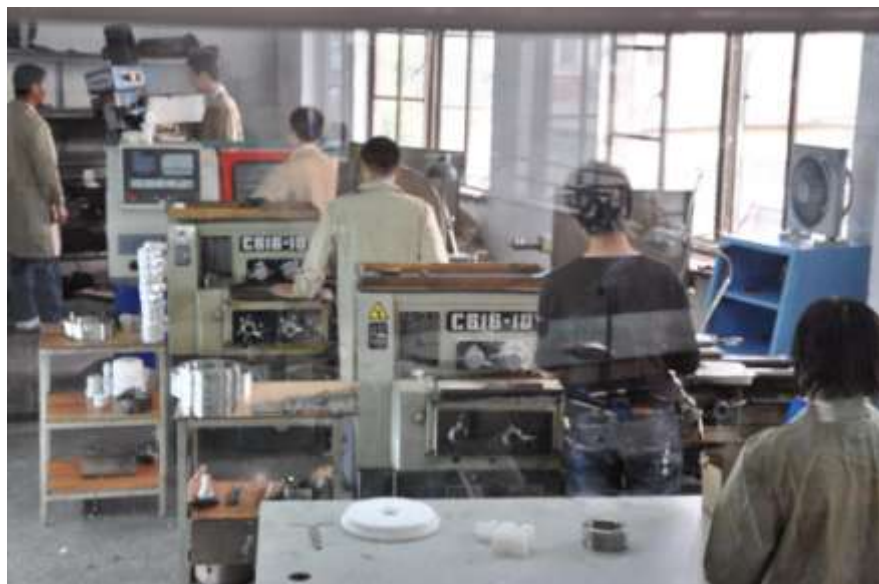
数控机床的精工制造