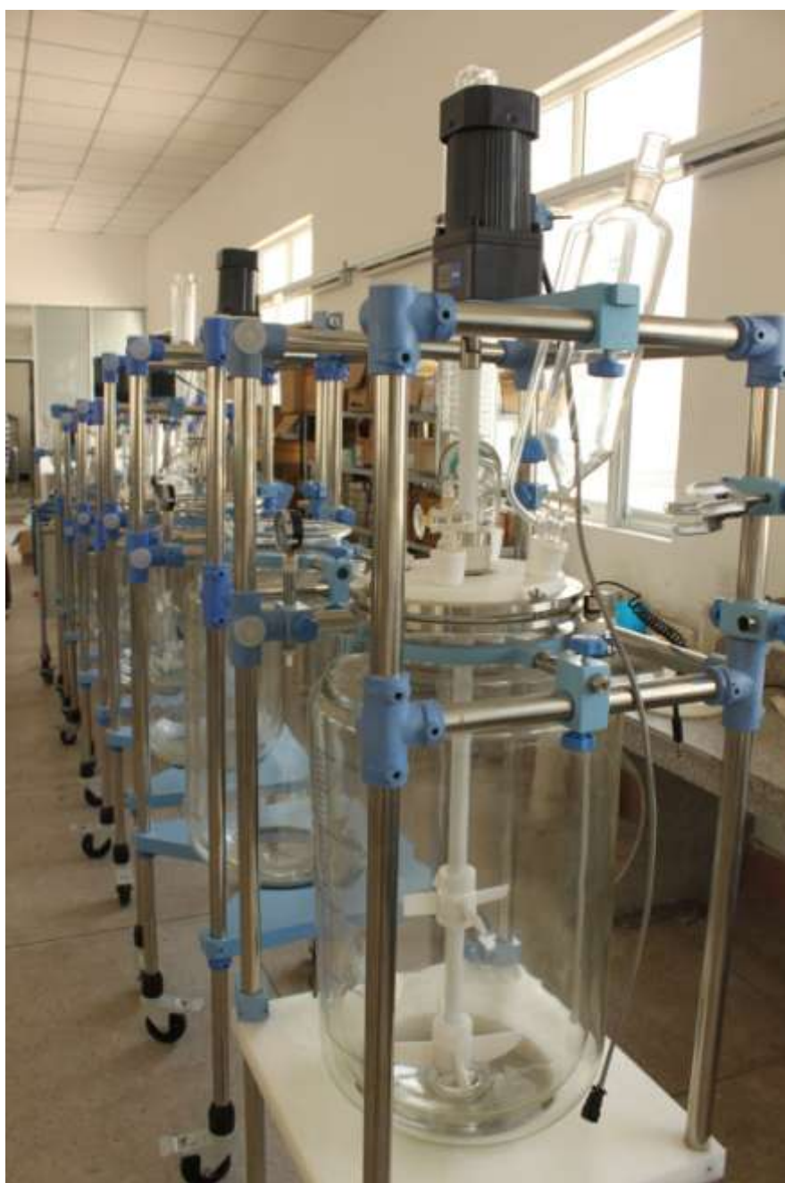
大型双层玻璃反应釜