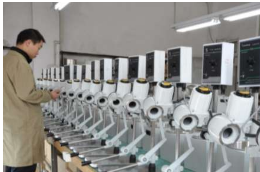
对每台设备均进行严格的出厂检验