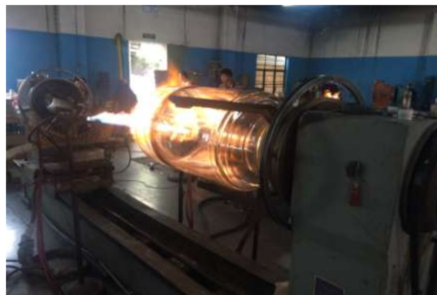
成熟的玻璃制造工艺